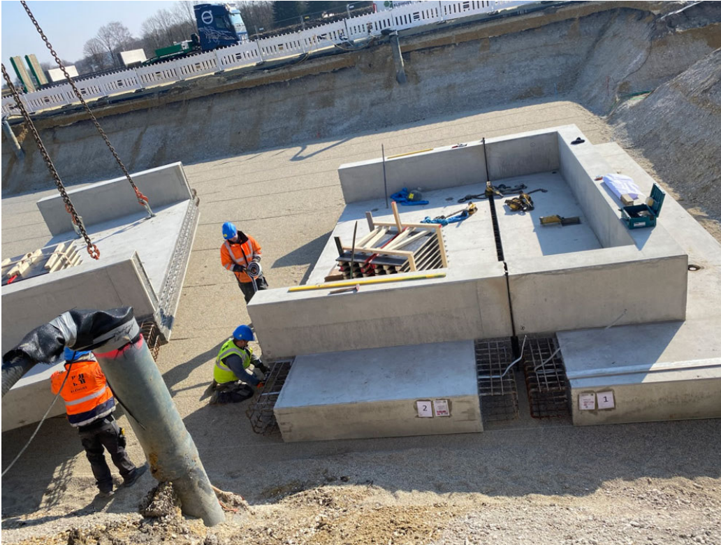
BU: Die vorproduzierten Elemente ermöglichen einen sehr schnellen Einbau auf der Baustelle, sind passgenau und zuverlässig und bieten schnell einen guten Schutz gegen das Eindringen von Wasser.