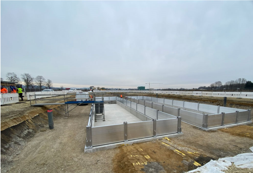
BU: Die eingezogenen Dammbalken aus Alu bieten einen guten Schutz gegen Hochwasser.