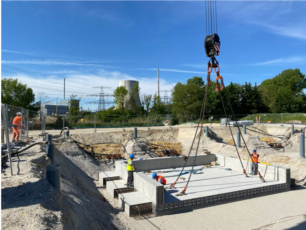
BU: Die Montage der bis zu 35 Tonnen schweren Betonelemente erfolgte passgenau vom Montageteam der Firma Kleihues mit Mobilkran.